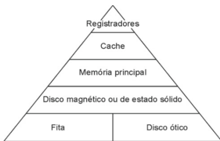
Fonte: Andrew S. Tanenbaum. Organização estruturada de computadores . 2007).

17. O computador mais simples com barramento possui uma CPU ( Central Processing Unit – Unidade central do processamento), memória principal e dispositivos de entrada e saída. Assim, quando precisamos armazenar e acessar programas e dados, precisamos entender a hierarquia de memória, conforme podemos visualizar a figura abaixo.